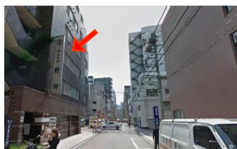
③100mほど進むと左に「野田ビル」が