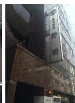
④入口はこちら。4階へどうぞ